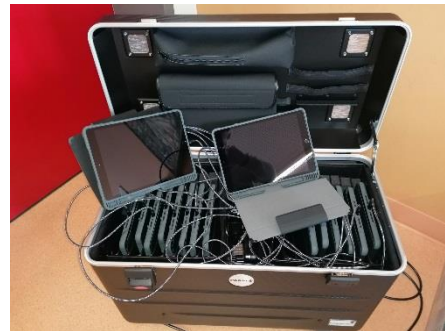
Die ersten 65 iPads sind da !

Mit Hilfe des Lerntagebuchs planen und strukturieren die Schüler ihre Arbeit. Die Erziehungsberechtigten erhalten über das Lerntagebuch auch ständig Informationen über den Leistungs- und Entwicklungsstand ihrer Kinder. Zukünftig wird dies durch die Lernplattform DILER unterstützt. Über DILER halten die Eltern auch optimalen Kontakt zu den Lernbegleitern und zur Schule insgesamt. Damit das Lernen optimal verlaufen kann, beabsichtigen wir die Einführung von Tablets für jeden Schüler . Diese werden kein Ersatz sein für Heft und Füller, sie unterstützen aber das Arbeiten in und außerhalb des Unterrichts.